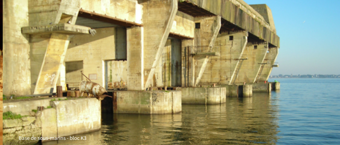
Base de sous-marins - bloc K3