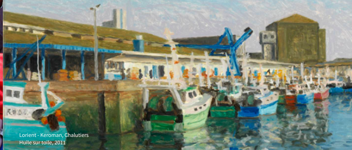
Lorient - Keroman, Chalutiers Huile sur toile, 2011