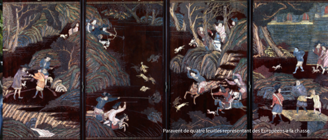
Paravent de quatre feuilles représentant des Européens à la chasse