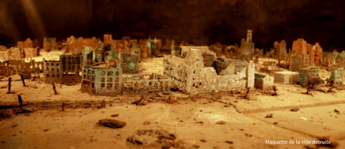
Maquette de la ville détruite