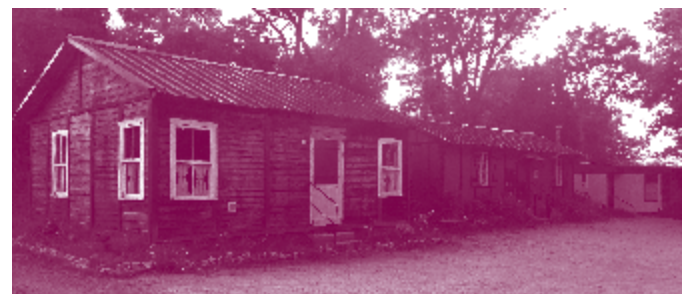
Les Baraques de Soye

De 3€10 à 5€10 - Gratuit pour les moins de 12 ans